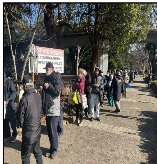
写真2-食料を受け取るホームレスの方々